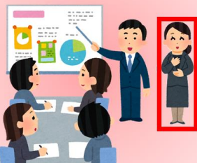
集合型研修・ミーティング 等